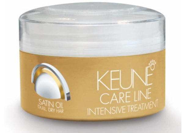
Artnr 21210 Care Line Satin Oil Intensive Treatment