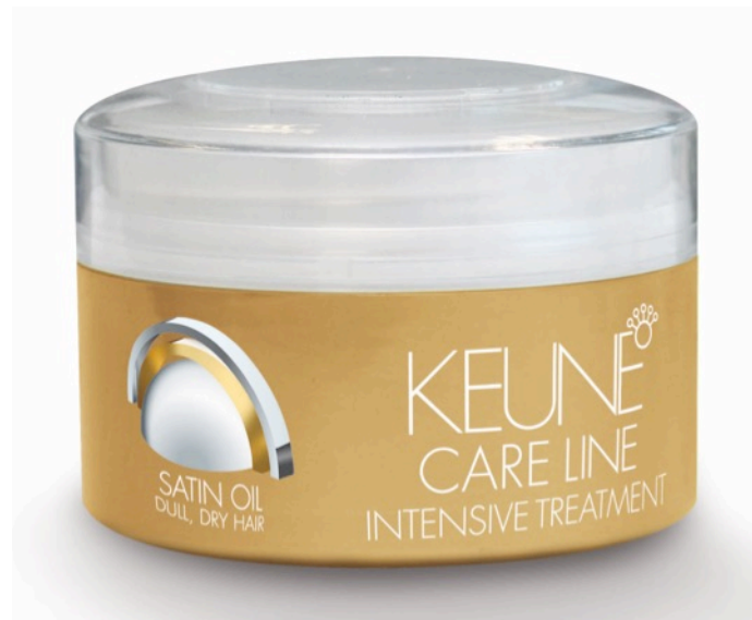
Care Line Satin Oil Intensive Treatment 200ml jar