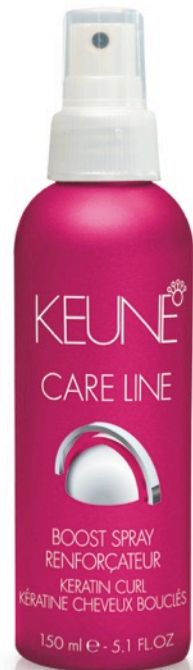
Boost Spray 150ml