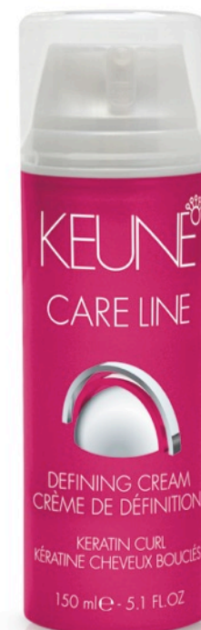
Curl Defining Cream 150ml